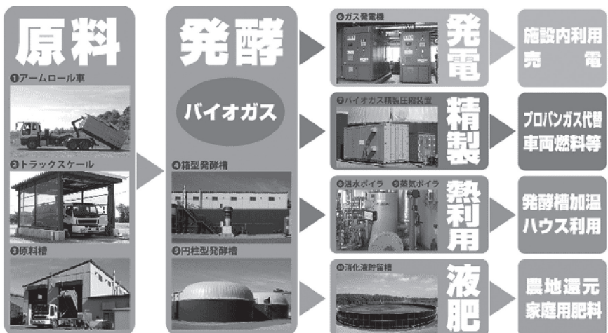
図表3 鹿追町環境保全センターバイオガスプラント

鹿追町環境保全センターのバイオマスプラントは、同町の家畜ふん尿発生量の一〇分の一にあたる酪農一戸の乳牛ふん尿を処理し、発生するバイオガスから発電機二基で電気と熱を生産しています。