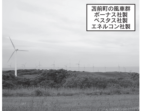
苫前町の風車群 ポーナス社製 ベスタス社製 エネルギー社製

営三基、海沿いの町営牧場にはユーラスエナジー二〇基、電源開発系が一九基、計四二基、総出力五万二千 キロワット の風車が一九九八年から二〇〇〇年にかけて建設され、日本初の本格的なウインドファームとして操業を始めました。