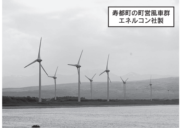
寿都町の町営風車群 エネルコン社製

で段階的に増設してきた。さらに、収益を得て町財政を支えるという明確な目的があり、かつ地元資源を活用する。